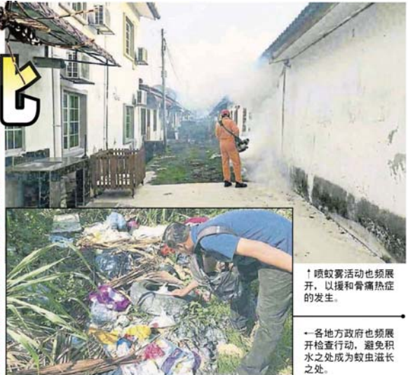
↑ 喷蚊雾活动也须展开,以缓和骨痛熱症的发生。