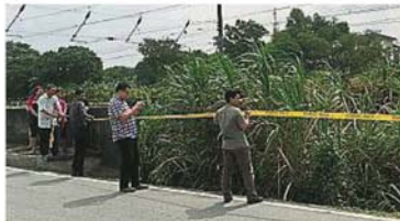
▲马路崩裂处已用黄色警戒线围起,提醒道路使用者小心注意。