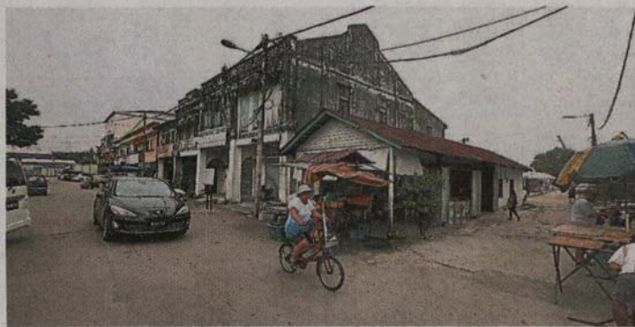
林记茶餐室照常营业。