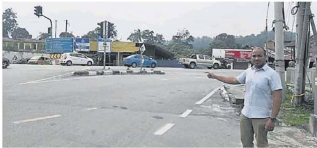
莫哈末依凡指会向公共工程局建议，加强斜坡路段的安全措施。