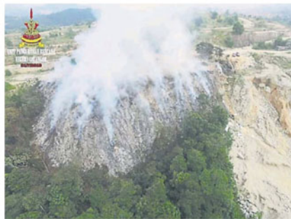
双溪龙非法垃圾场着火情况。

他说，双溪龙地区的空气污染指数是 89 点，巴生佐兰瑟迪亚地区则超过 100 点，属于不健康水平，但无法确定雪