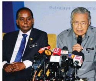
马哈迪(右)否认内阁暂停62亿令吉收购大道的献议, 左为人力资源部部长古拉。

否认内阁暂停收购大道献议 敦马:落实日期尚未决定 首相敦马哈迪否认内阁暂停以62亿令吉, 收购大道的献议。 他今天在布城国际会展中心与国际商联会举行的圆桌会议后, 针对有报道指内阁暂停财政部收购金奈大道的计划。 他说, 财政部说撤回收购大道的建议是可行, 只是政府缺乏资金, 但财政部认为实施拥堵费可以让政府筹集足够的资金来收购四条大道。 “我们得看(资金)是否足够。” 在询及收购大道是否因内阁部长的反对而喊停时? 马哈迪连连否认: “不、不、不, 没有这回事, 财政部长向内阁提出这项献 议时, 我们并没有拒绝, 只是落实日期尚未决定。” 根据新加坡《海峡时报》报道, 马来西亚中央政府包括内阁成员认为, 财政部献议以62亿令吉价格收购大道过高, 因此暂时暂停这项建议, 同时重新审查献议的价格。 财政部在今年6月宣布, 将通过发行债券的方式, 以总值62亿令吉向金奈大收购旗下4条大道特许经营权, 这个方式将不会为纳税人带来任何损失。 有关的收费大道包括白蒲大道(LDP)、西部疏散大道(SPRINT)、莎阿南大道(KE-SAS)及精明隧道(SMART)。#