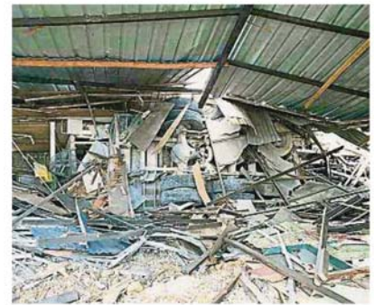
上星期发生的罗里撞店事件, 虽然没有酿成人命伤亡, 却已引起恐慌。