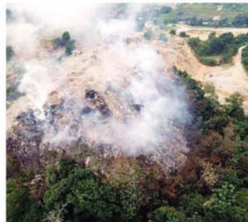
加影地区非法垃圾场发生火患造成浓烟滚滚，适逢印尼烟霾又来袭，加影地区民众面对“双烟”左右夹攻。

“身为地主，有义务照顾及了解本身土地的情况。因此，除了罚款外，土地局也发出通令，