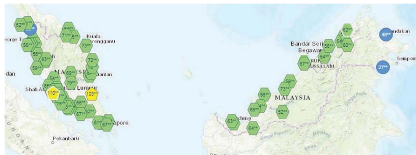
Kedaaan IPU di seluruh negara setakat jam 4 petang semalam.

laman sesawang Sistem Pengurusan Indeks Pencemaran Udara Malaysia (APIMS) setakat jam 4 petang semalam, sebanyak 62 stesen mencatatkan bacaan sederhana antara IPU 51 hingga IPU 100 dan empat stesen lagi mencatatkan bacaan baik.