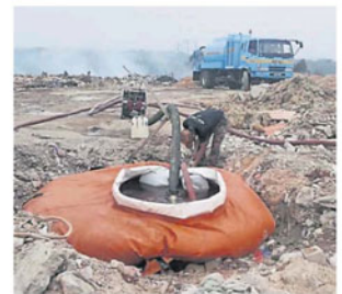
拯救人员挖掘地下水灭火。

此外，他也说当局发现丢在双溪龙非法垃圾场的垃圾以工业废料、建筑垃圾、酒店和购物广场的垃圾为主。