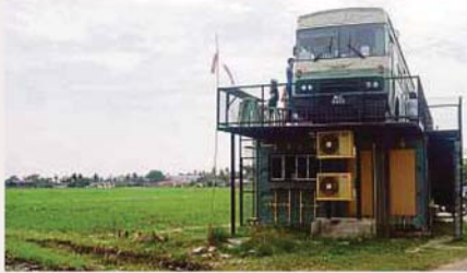
SAWAH padi di Sekinchan.

Kata gadis manis berusia 39 tahun ini yang juga aktivis alam sekitar menerusi sosial Interprise Kloth Malaysia Sdn Bhd yang ditubuhkan enam tahun lalu berpendapat percutian yang tidak dirancang itu membantu mengurangkan tekanan selepas penat dengan