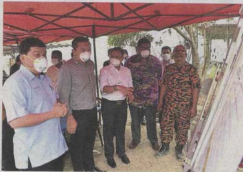
(From left) Hee and Ng being briefed on efforts to put out the fire at the illegal dumping ground. Firemen have been battling the blaze since July 30.

114m wide. The safety of our firemen is at stake. However, the fire is expected to be put out in five to seven days,” he said.