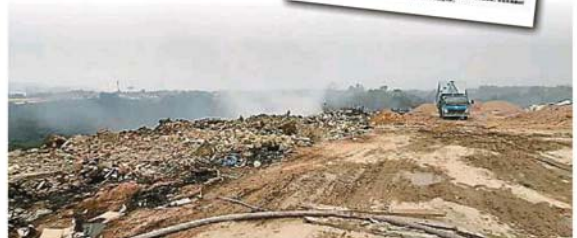
消防员连日向垃圾火灌水，冒烟情况减少。