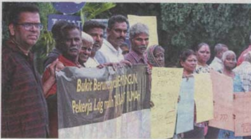
Estate workers from Bukit Beruntung holding a peaceful demonstration outside the state secretariat building.

By FARID WAHAB faridwahab@thestar.com.my