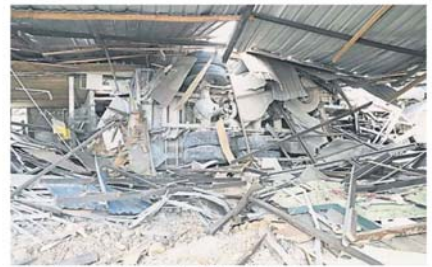
罗里飞撞进入店内，所幸当时店铺还没开门营业。