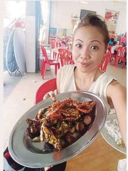
MENIKMATI hidangan popular tempatan.