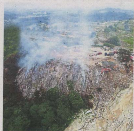
An aerial view of the fire at the illegal dumping ground next to the Sungai Long toll plaza.

State local government, public transport and new village develop-