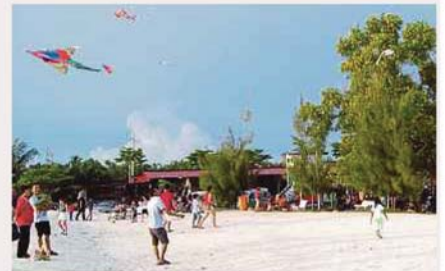
KEMERIAHAN Pantai Redang menjadi tumpuan pengunjung luar dan tempatan.

mengambil kesempatan menghargai keindahan kepelbagaian kaum, agama mahupun budaya Malaysia dengan melihat seni bina rumah ibadat pelbagai kaum di pekan terbabit.