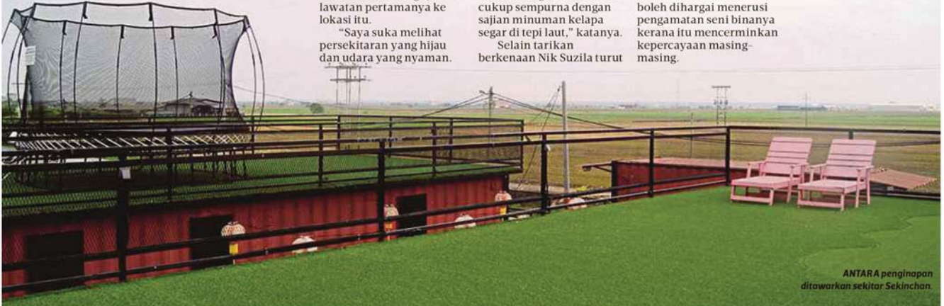
ANTARA penginapan ditawarkan sekitar Sekinchan.

Katanya seperti melawat pusat relik lain, rumah ibadat baik Hindu atau Buddha boleh dihargai menerusi pengamatan seni binanya kerana itu mencerminkan kepercayaan masing-masing.