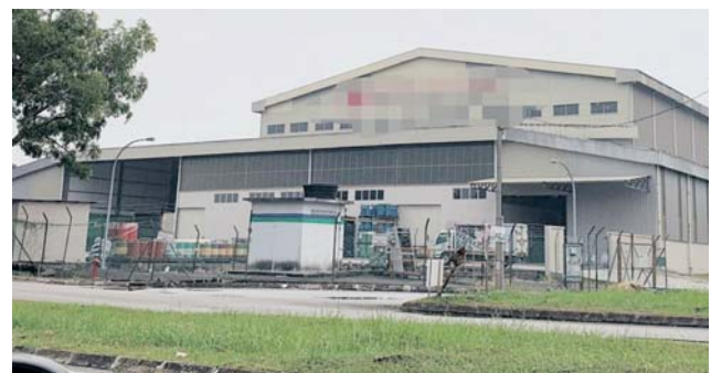
Kilang di Kapar, Klang yang didakwa melarang pekerja Muslim solat pada waktu kerja.

Notis makluman bertarikh 30 Julai 2019 berkenaan tular di media sosial sejak