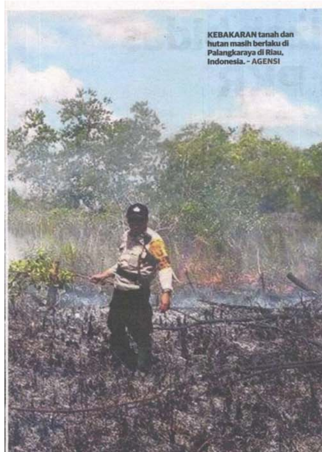
KEBAKARAN tanah dan hutan masih berlaku di Palangkaraya di Riau, Indonesia.

Bulan ini kami meramalkan cuaca kering dan jerebu dijangka berterusan hingga lima hari. Orang ramai dinasihatkan mengurangkan aktiviti luar dan elak daripada melakukan pembakaran terbuka