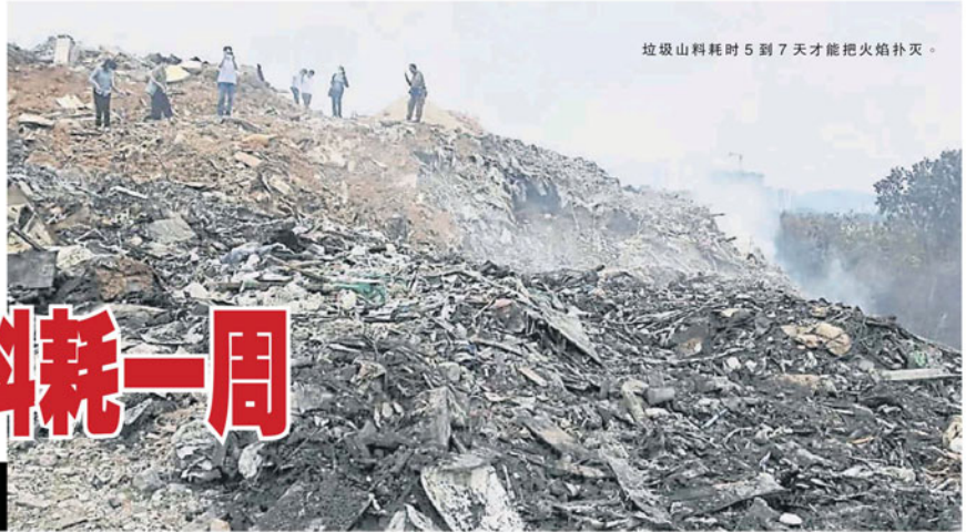
垃圾山料耗时 5 到 7 天才能把火焰扑灭。