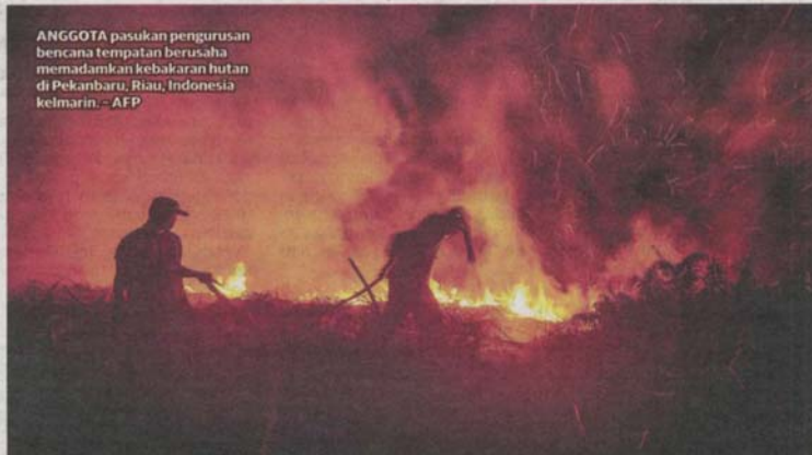
ANGGOTA pasukan pengurusan bencana tempatan berusaha memadamkan kebakaran hutan di Pekanbaru, Riau, Indonesia kelmarin.

"Bulan ini kami meramalkan cuaca kering dan jerebu dijangka berterusan hingga lima hari. Orang ramai dinasihatkan mengurangkan aktiviti luar dan elak daripada melakukan pembakaran terbuka," katanya seperti dilaporkan Bernama hari ini.