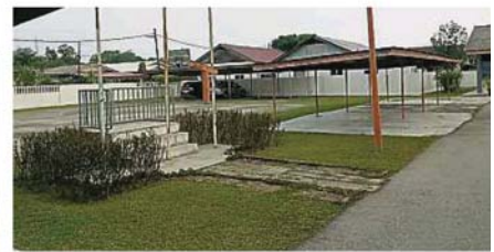
吉舞華小全校逾百師生的活動空間，便是校內唯一的露天籃球場。