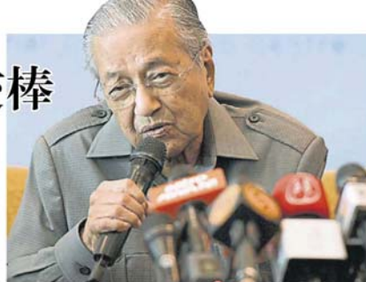
能需 3 年，我不确定，但我们正在努力朝这个方向走。”

“那是他（阿兹敏）的个人意见，他认为我应继续（留任），但我已保证，在我认为国家的情况已经好转，我就会下台，这可能需 2 年，也可