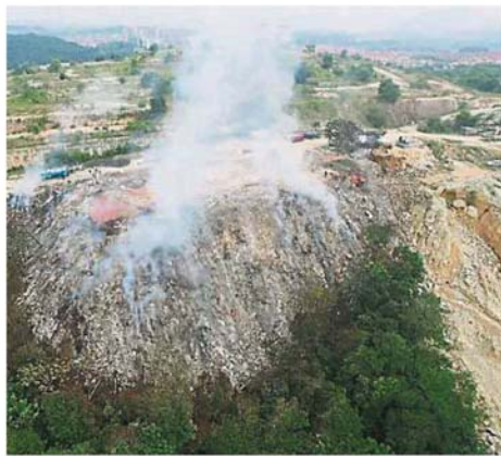
民防部队出动航拍器，协助记录非法垃圾场的情况。