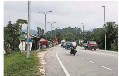
这段从安邦前往呀吃十四哩十字的路段, 是最多罗里使用, 居民要求在这路段增设安全措施。

生两次罗里撞店事件, 为最危险的路口, 过去一星期, 依凡表示该十字路口被居民认