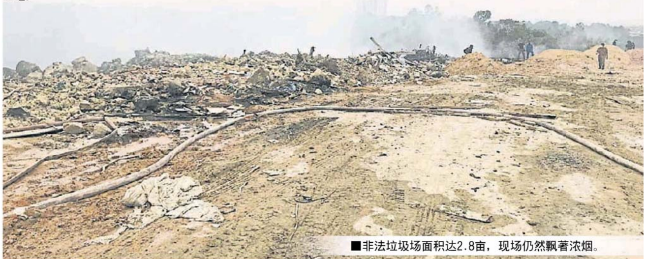
■非法垃圾场面积达2.8亩，现场仍然飘著浓烟。