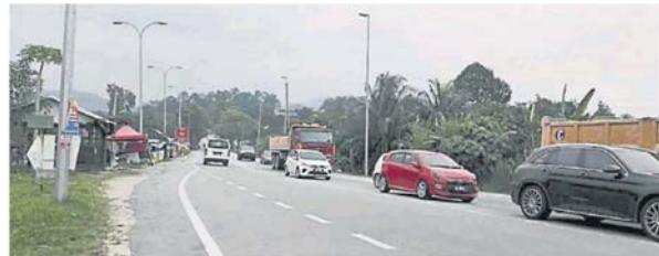
500 公尺长的下斜坡路段，危机四伏。