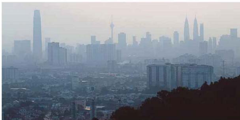
Pemandangan udara di sekitar Kuala Lumpur, semalam.

Empat lagi stesen mencatat bacaan baik, iaitu di Sandakan dan Tawau, Sabah, dengan bacaan IPU