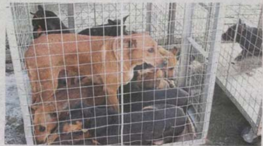
Stray dogs caught by Ampang Jaya Municipal Council are kept for seven days for the owners to claim them before being put down.